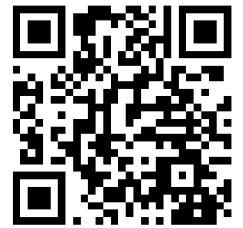
報名表 QR Code